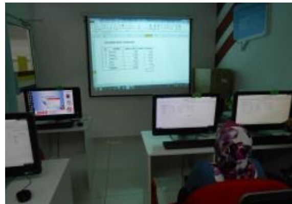
Pn Rosmahwati mengikuti kelas latihan Keusahawanan (Microsoft Excel) – membuat pengiraan kewangan perniagaan