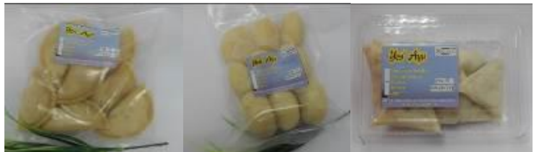
Caption : Antara perkhidmatan yang disediakan iaitu tempahan masakan catering, menghasilkan produk makanan sejuk-beku.