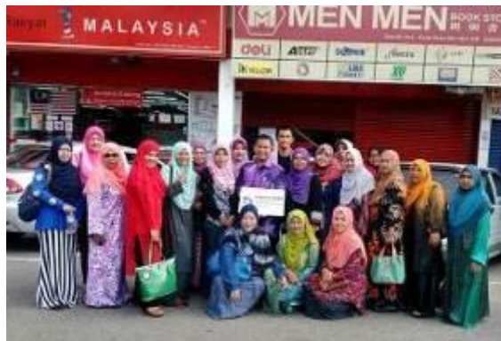
Caption : Pn Ayu menyertai program latihan yang dianjurkan oleh Empower Acer Maran, Pahang.

iv) Lain-lain (contoh : proses penghasilan produk, penglibatan dalam aktiviti lain, dsb)